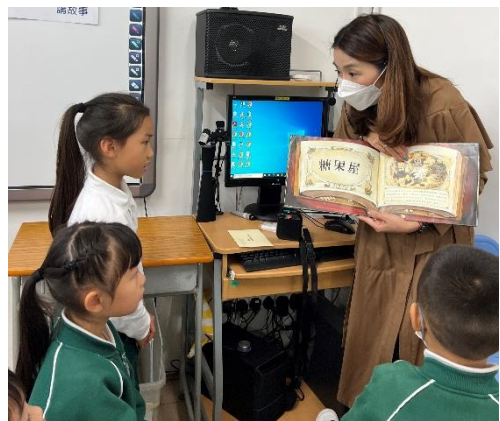
同學正在專心聆聽故事