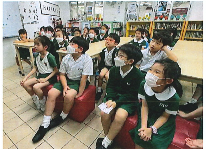
大姐姐講得認真，小朋友聽得專心