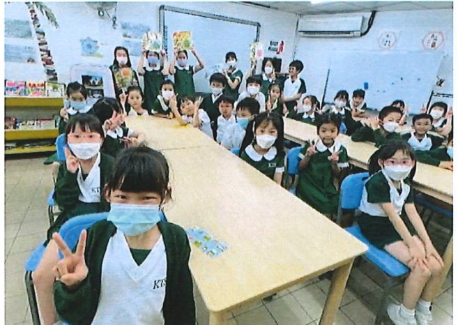
大姐姐以其中一個品德故事作引子，引導同學自主地閱讀其他品德教育的故事