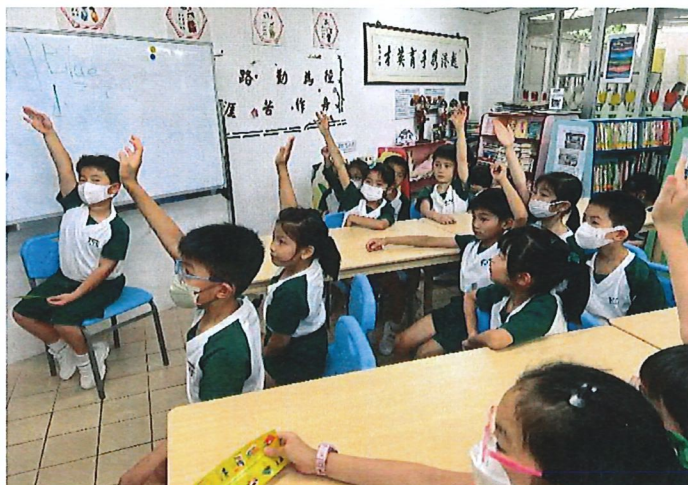
同學專心聆聽家長講故事，並積極舉手回答問題