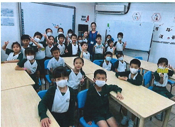
聽完故事，大家一起來拍大合照，感謝家長義工的分享